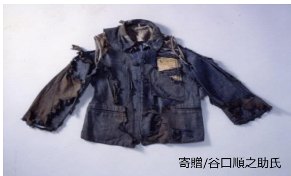
寄贈/谷口順之助氏